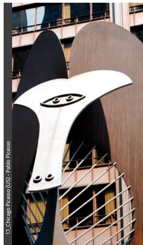
1.1_Chicago Picasso (US) - Pablo Picasso

Bien que légèrement plus cher que l'acier de construction ordinaire, l'acier auto-patinable présente de nombreux avantages économiques. Les frais de protection supplémentaire contre la corrosion sont éliminés. Ceci concerne non seulement le prix de revient du matériau et de