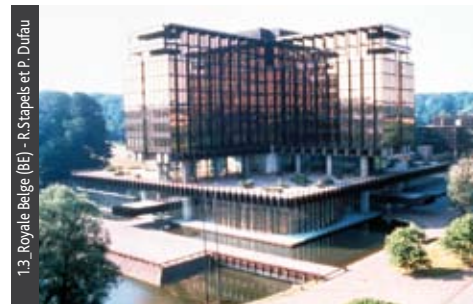
1.3_Royale Belge (BE) - R.Stapels et P. Dufau

Il faut partout un bon écoulement et une bonne évacuation de l'eau. Il en va de même au niveau des joints, des raccords et des chevauchements de revêtements de façades. Depuis lors, des études approfondies sur ces aspects essentiels de conception ont été réalisées dans un grand nombre de pays et ont permis de constituer une solide expérience dans ce domaine. Toutes les questions importantes ont ainsi pu trouver une réponse définitive, et une série de détails-types ont été élaborés.